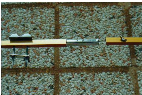
La giunzione del boom

L'ADATTAMENTO DI IMPEDENZA è stato realizzato con un Hairpin fatto, dapprima, con due barrette di filo di rame rigido da 2 mm cortocircuitate da un ponticello mobile. Spostando il ponticello ho trovato il punto di ROS minimo mentre accorciando leggermente i due mezzi elementi del radiatore ho portato la risonanza a 144.300. Trovate le giuste dimensioni, ho poi rifatto l'hairpin con un unico pezzo di filo piegato ad U.