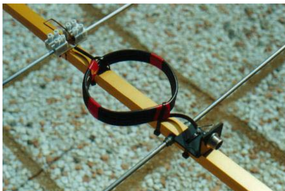
Il simmetrizzatore di corrente e l'Hairpin

LE CARATTERISTICHE rilevate da YO sono: Guadagno = 11.66 dBd, F/R = 31.98 dBd, il ROS misurato in banda SSB = 1.2-1.3.